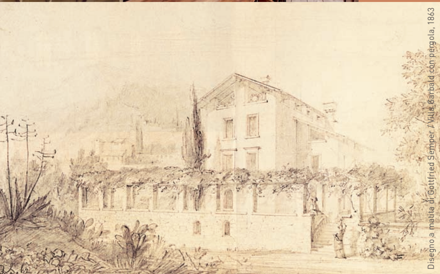
Disegno a matita di Gottfried Semper. Villa Garbald con pergola, 1863

L'EREDITÀ GARBALD UNA RICCHEZZA CULTURALE IN BREGAGLIA: letteratura, fotografia, biblioteca e la Villa Semper